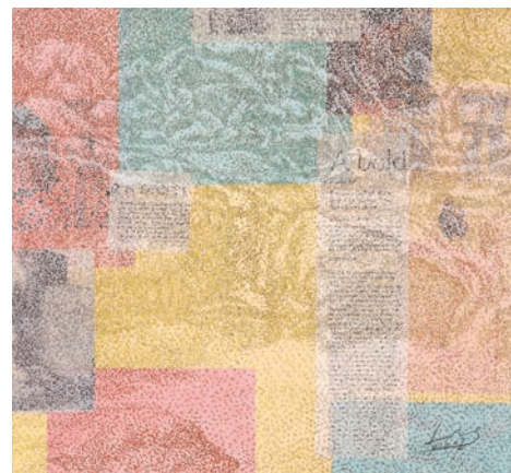
Lee Gilwoo, 2 ou 5 ou 03 , 2016, Indian ink coloring, soldering iron (incense) and coating on Korean paper, 80 x 80 cm.

Les œuvres qu'ils produisent incarnent à la fois une pensée, un sentiment et un processus créatif empreint d'humanité. A travers une riche diversité de matériaux, ces œuvres, encore peu connues en Europe, reflètent une qualité de travail exceptionnelle et d'une rare authenticité.