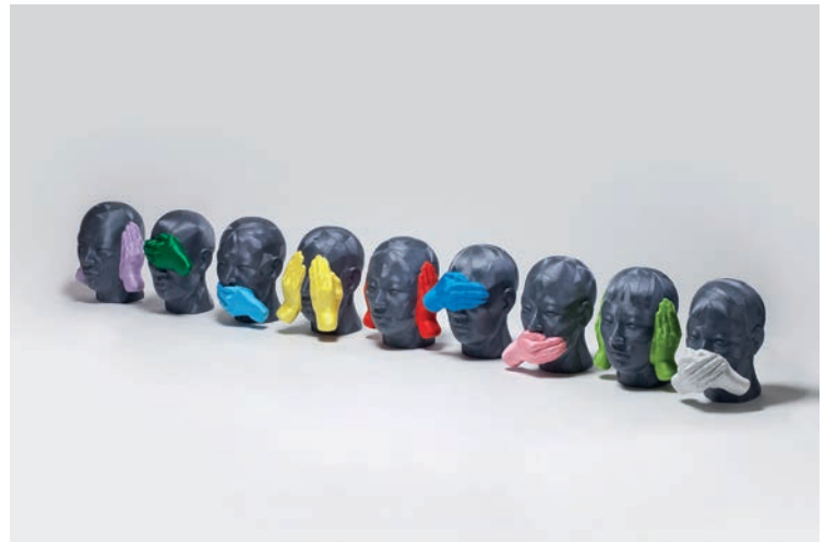
June LEE, Witness , 2013, thread on plastic cast, 33 x 27.9 x 25.4 cm (each).

- / Following the success of the first exhibition in 2017, confirmed by the public's reception at Asia Now Paris in October 2018, Artvera's gallery is proud to present until March 3rd 2019, a new selection of South Korean artists.